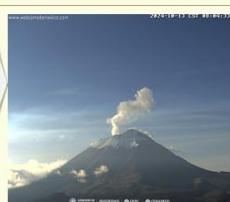
Imagen destacada de las últimas 24 horas

CON LA PARTICIPACIÓN DEL INSTITUTO DE GEOFÍSICA DE LA UNAM